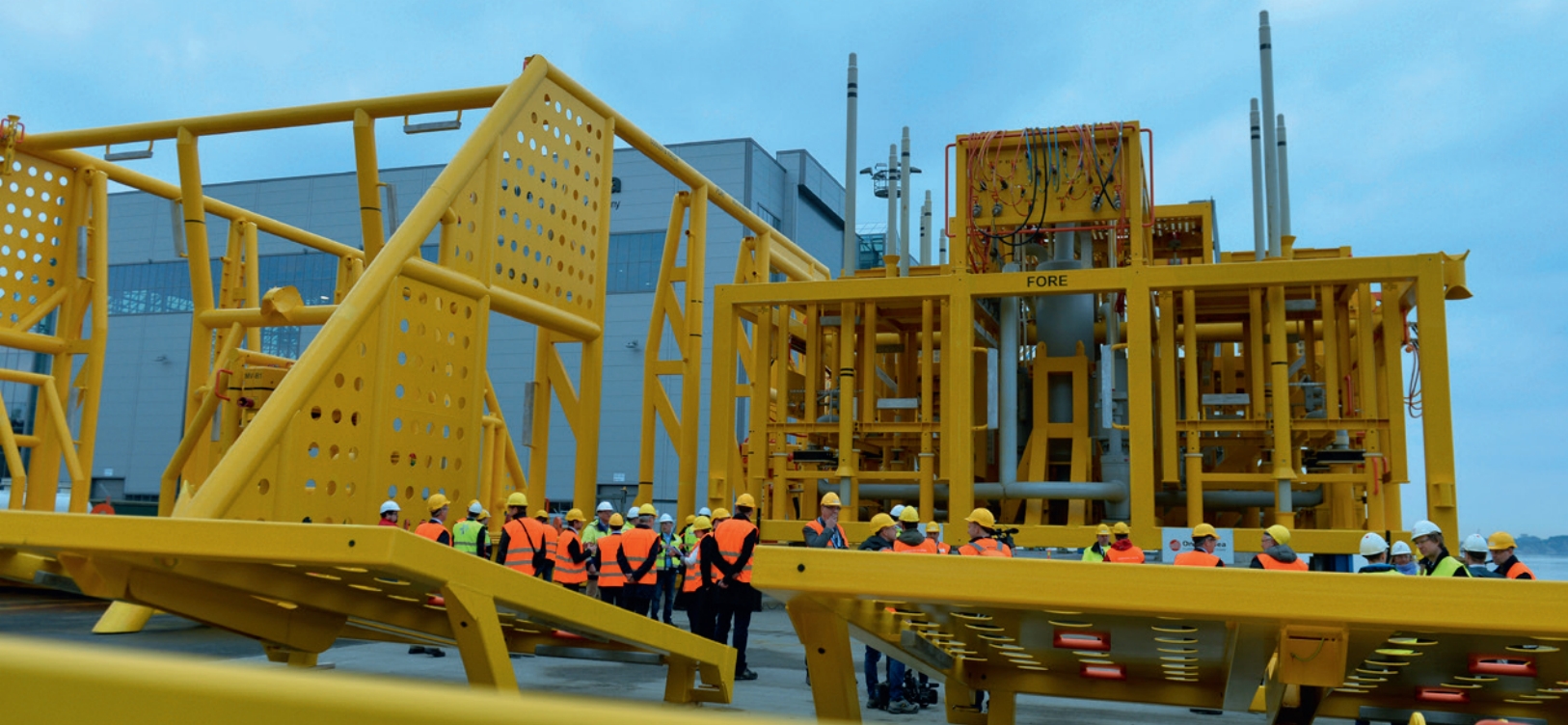
Gullfaks våtgass subseakompressor.

Gjennomsnittlig totalproduksjon hittil i år var 1 046 kboed mot 1 001 kboed for samme periode i 2014. Olje og NGL produksjonen viste en økning på 3,5 prosent, mens gassproduksjonen var fem prosent høyere enn samme periode i fjor. Totalt salgsvolum fra egenproduksjon for SDØE var 1 057 kboed som var 6,3 prosent høyere enn samme periode i fjor.